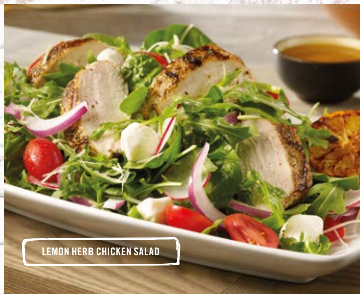
LEMON HERB CHICKEN SALAD

Krokant gefrituurde kipvingers bedekt met gesmolten Monterey Jack geserveerd op geroosterd brood met knapperige bacon, sla, tomaat en mayonaise. Geserveerd met frites.